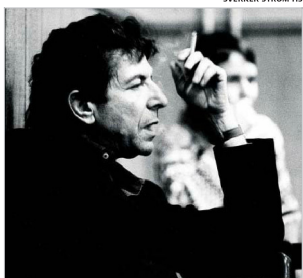
Leonard Cohen Helsingissä vuonna 1987.