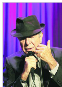
Cohen esiintyi Helsingissä 2010.